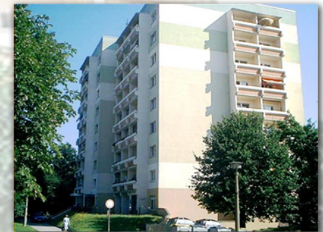
Punkthochhaus PH 9

Integratives Wohnen mit Betreuungsangeboten